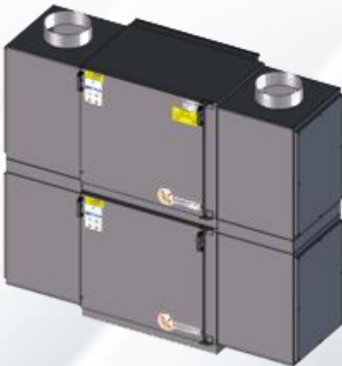
DC 4.0 V